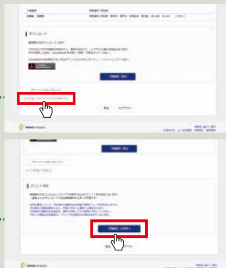
※画面イメージはパソコン画面でのサンプルです。実際の出願時に変更される場合があります。